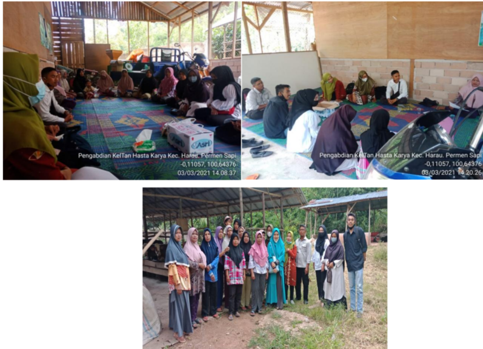
Gambar 2. Kondisi saat penyampaian materi penyuluhan di Kelompok Hasta Karya

Pemberian perment jilat dapat memenuhi kekurangan mineral yang terjadi pada sapi, sehingga dapat meningkatkan produktivitas ternak. Serta meningkatkan nafsu makan dari ternak. Kalau nafsu makan meningkat ini akan berkorelasi positif terhadap pertambahan bobot badan sapi. Dengan pertambahan bobot badan yang signifikan ini diharapkan dapat memenuhi bobot akhir yang diinginkan peternak. Dalam waktu 2-3 bulan masa pengemukkan, ternak sapi sudah bisa dipanen atau dijual. Apabila sapi gemuk maka peternak akan mendapatkan keuntungan.