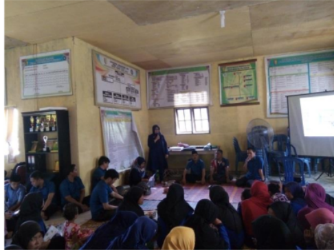
Gambar 3. Antusias masyarakat dalam kegiatan sosialisasi

6.90% dan total antosianin 2.40 mg/100 gr, sedangkan hasil organoleptik dari segi warna menunjukkan berwarna agak ungu, segi aroma beraroma daging, segi tekstur kenyal, dan segi citarasa berasa daging.