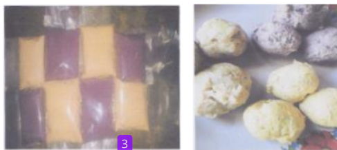
Gambar 2. Tepung Ubi Jalar dan Bakso

Antusias masyarakat dalam pembuatan bakso pelangi, dapat menjadi salah satu peluang usaha yang cukup diminati dengan memanfaatkan ubi jalar dengan varian warna yang berbeda-beda sebagai pewarna alami pada makanan. Beberapa hasil penelitian menunjukkan bahwa penambahan tepung ubi jalar dapat meningkatkan kualitas organoleptik pada bakso. Dalam Wulandari (2015) dan Yunita (2015), substitusi tepung ubi jalar ungu dan ubi jalar kuning hingga 80 gr dapat meningkatkan kualitas organoleptik dari segi rasa memiliki rasa daging ada, ada rasa ubi, segi aroma agak amis, segi warna menunjukkan warna ungu, segi tekstur agak kenyal, dan tingkat kesukaan menunjukkan suka. Kemudian penelitian Fitriani (2016), penambahan larutan daun pandan wangi hingga 2% pada bakso ayam dapat mempertahankan kualitas organoleptik dari segi rasa menunjukkan ada rasa daging, tidak ada rasa pandan, segi aroma agak amis dan sedikit aroma pandan, segi warna agak hijau, segi tekstur agak kenyal, dan segi tingkat kesukaan menunjukkan suka.